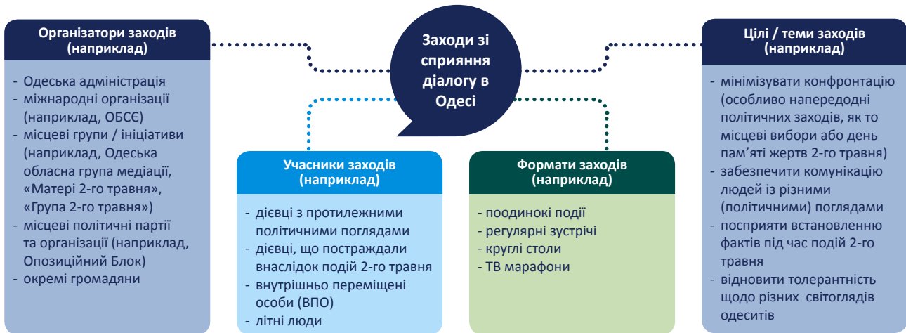
Діаграма 3: Спектр діалогових заходів, проведених в Одесі в 2015 році

Примітними є також розбіжності в оцінці обговорюваних подій: майже половина опитаних вважає, що усі зацікавлені мали чимало можливостей для діалогу, наголошуючи на успішності проведених заходів (наприклад, зустріч ОБСЄ напередодні 2 травня 2015 року, внаслідок якої швидше за все вдалося мінімізувати насильство). Трохи більше, ніж половина опитаних, навпаки, або скаржилася на недостатність в Одесі майданчиків для міжгрупового діалогу, або зазначала, що такий формат діалогу не здатний зібрати разом релевантних дієвців (як з Одеси, так і з-за її меж), організувати безпечний простір для комунікації, поставити на обговорювання конкретні конфліктні питання («один лише діалог про діалог») і, як наслідок, не матиме конкретних результатів.